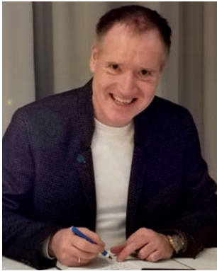
Von Michael Hauke

Wenn mir jemand vor der Bundestagswahl erzählt hätte, dass dreieinhalb Wochen nach den Wahlen ein längst abgewählter Bundestag gravierendste Grundgesetzänderungen beschließen würde und das Land mit einer zusätzlichen Schuldenaufnahme von rund einer Billion Euro belastet, wahrscheinlich sogar auf Generationen hinaus zerstört; ich hätte es nicht für möglich gehalten. Und das will schon etwas heißen. Denn seit Corona halte ich praktisch alles für möglich. Der Satz „Das können die doch nicht machen!“ gilt spätestens seit März 2020 nicht mehr. Nein, sie können alles machen!