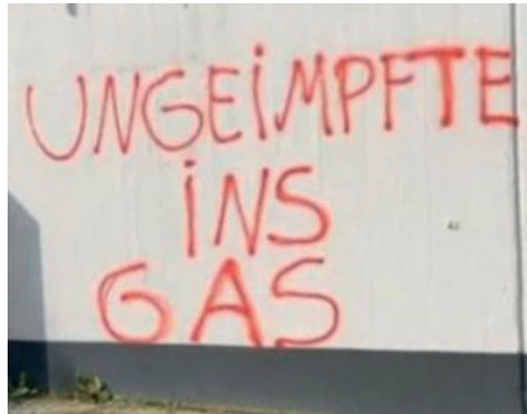
Graffiti im Jahr 2021.

Schreiben Sie uns gern Ihre Meinung zu diesem Kommentar an: info@hauke-verlag.de (Veröffentlichung in der kommenden Ausgabe)