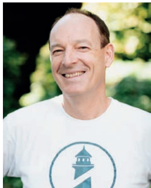
Von Jimmy Gerum

6) Alle EU Partner auffordern, bei der Absicherung und Überwachung der Pipeline mitzuwirken, insbesondere auch die anderen Ostseeanlieger. Die Anschläge fanden auf dem Staatsgebiet von Dänemark und Schweden statt betreffend Nordstream, die Sprengung der Pipeline