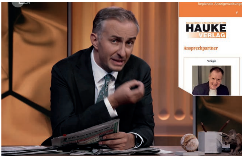
Der Hauke-Verlag begrüßt Jan Böhmermann als neuen Leser.

Dieser Kenner („Was weiß ich, wo das liegt!“) erklärt dann seinen Zu-