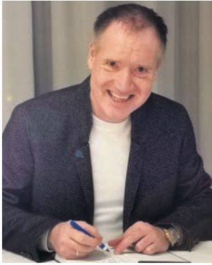
Von Michael Hauke

Die „demokratischen Parteien“ haben sich mit ihrer Anti-AfD-Taktik selbst geschlagen