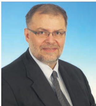
Von Ralf Ittermann

Ich bin der Geschäftsführer der Firma Ittermann electronic GmbH. Ich wurde 1961 in Wanne-Eickel geboren und habe dort meine Kindheit verbracht. Nach meinem 4-jährigen Dienst im Nato-Hauptquartier in Brunssum (NL) machte ich mich selbstständig und wanderte mit meiner Familie 1992 in den Osten aus – und zwar nach Thüringen. Ich versprach mir davon ein schnelleres Vorankommen meiner Firma, nicht zuletzt wegen der vielen gut ausgebildeten Fachkräfte dort.