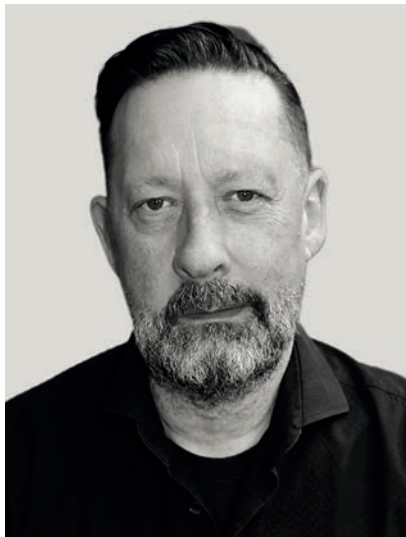
von Jan Knaupp

Heute möchte ich mich mal an ein heikles Thema wagen. Es ist ja nicht neu, dass die Kommunikation zwischen Frauen und Männern nicht immer einfach ist. Woran kann das liegen? An uns Männern jedenfalls nicht! Obwohl meine Recherchen ergeben haben, dass uns vorgeworfen wird, wir würden nicht richtig zuhören und entgegengenommene Nachrichten nicht präzise weitergeben – an sie.