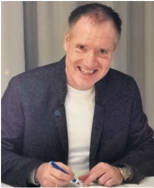
Von Michael Hauke

Keine einzige der menschenverachtenden und zerstörerischen Corona-Maßnahmen war mit den offiziellen Zahlen des RKI oder des DIVI-Intensivregisters zu rechtefertigen. Keine einzige! Darauf habe ich in jeder Ausgabe der drei Zeitungen des Hauke-Verlages seit dem Frühjahr 2020 hingewiesen. Es war kein Hexenwerk, das herauszufinden; alle Zahlen waren öffentlich zugänglich. Auch jeder Mainstream-Journalist war nur wenige Klicks von der Wahrheit entfernt.